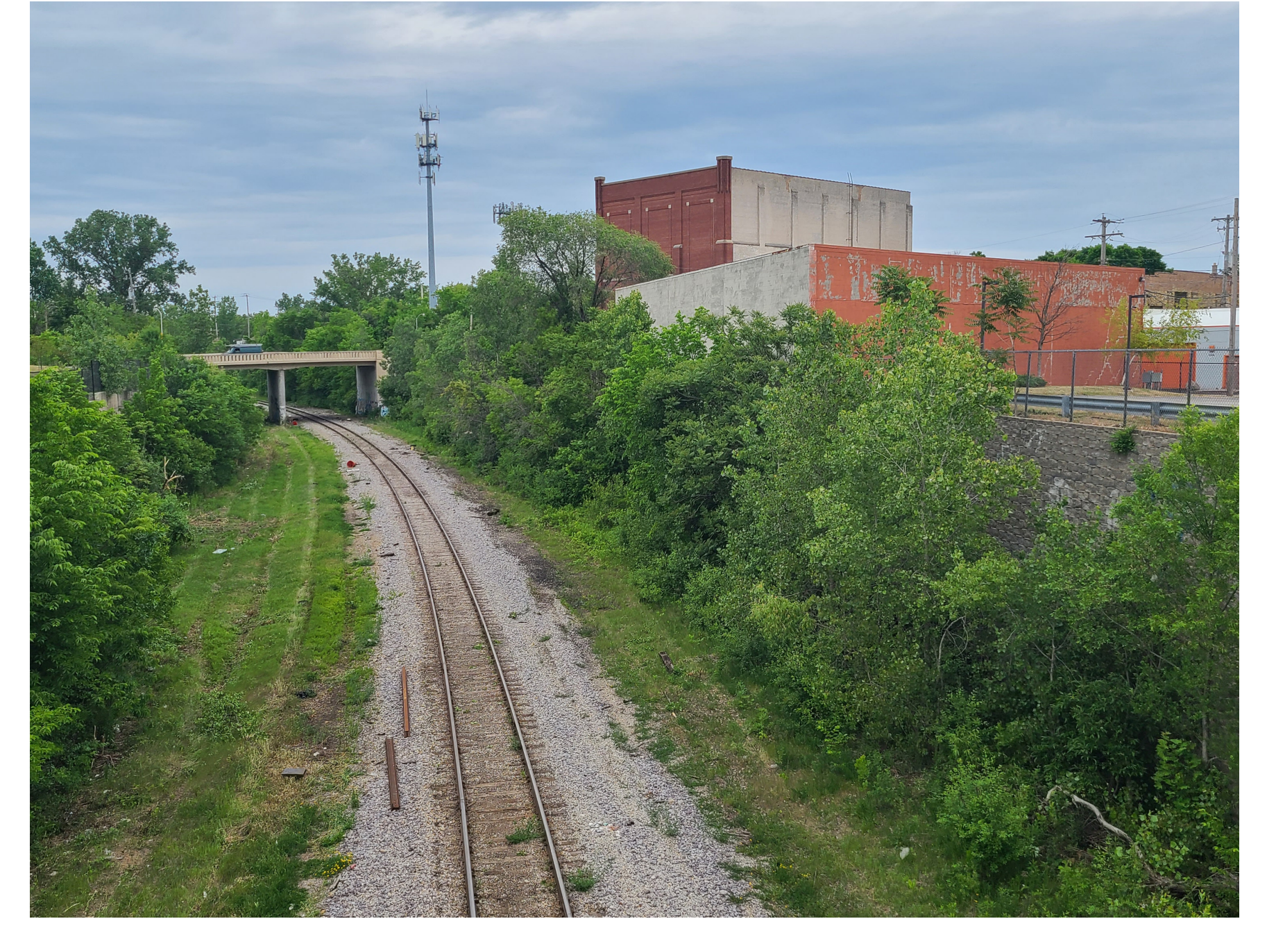
Rail corridor north of W. Cherry Street bridge, looking north