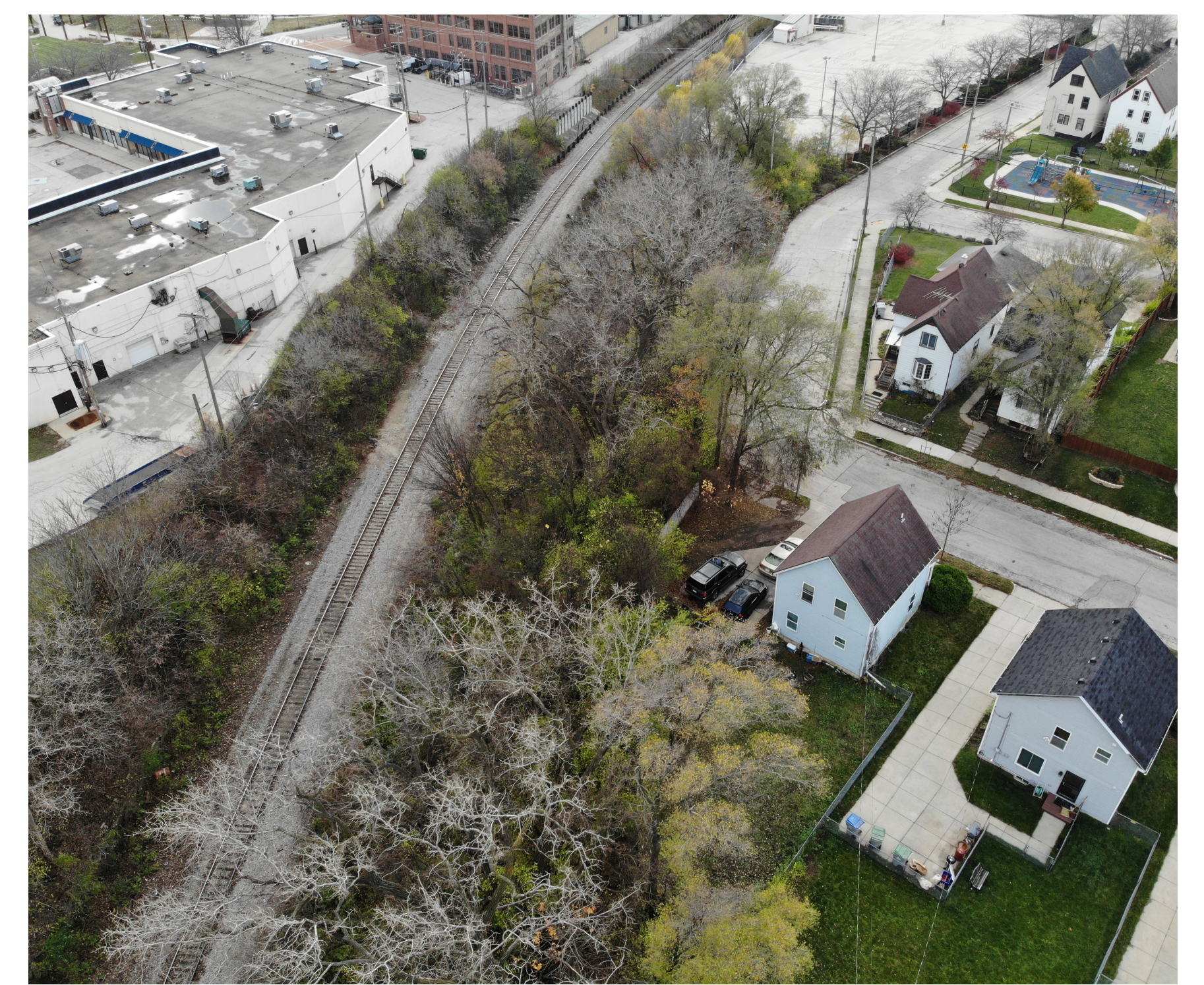
Rail corridor south of N. 35th Street, looking south