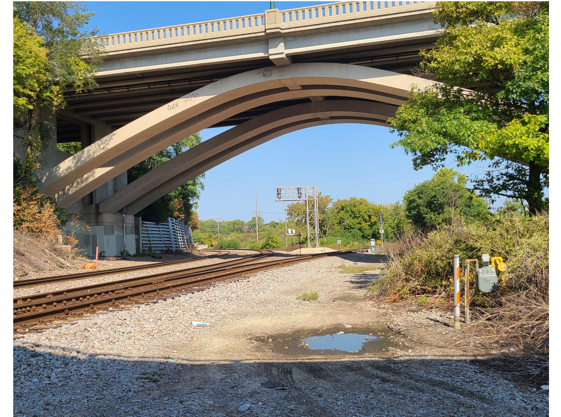
Rail corridor below W. Wisconsin Avenue bridge, looking north