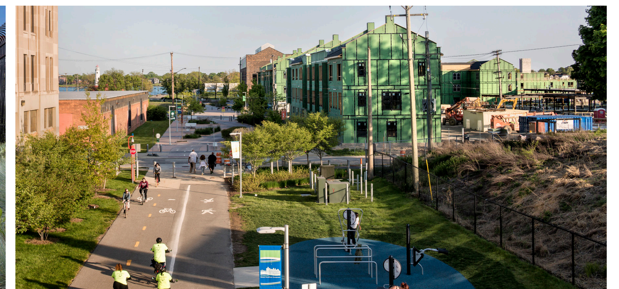
Images of the Dequindre Cut trail in Detroit which transformed an abandoned rail corridor into a safe and vibrant destination